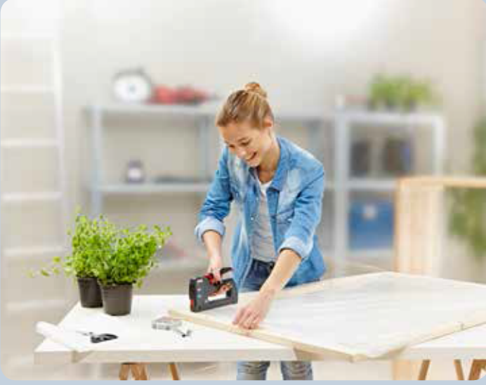
Kaplamaların kolayca takılması