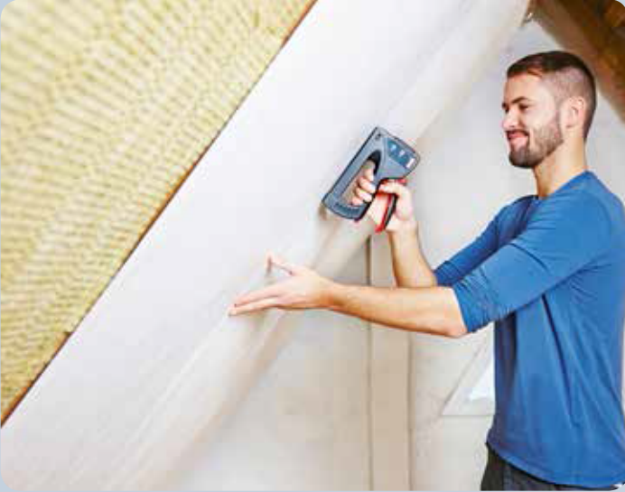
Çatı ve vb. kaplama işleri