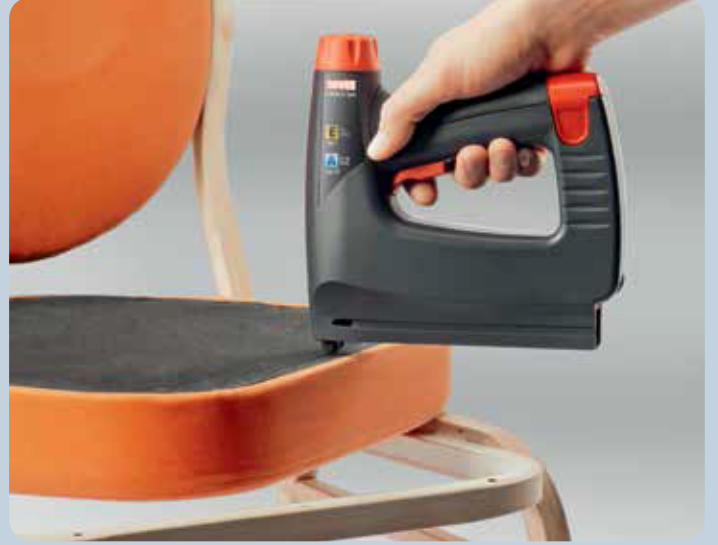
Koltuk döşemeleri gibi dekoratif uygulamalar için hızlı, zahmetsiz ve kablosuz zımba tabancası