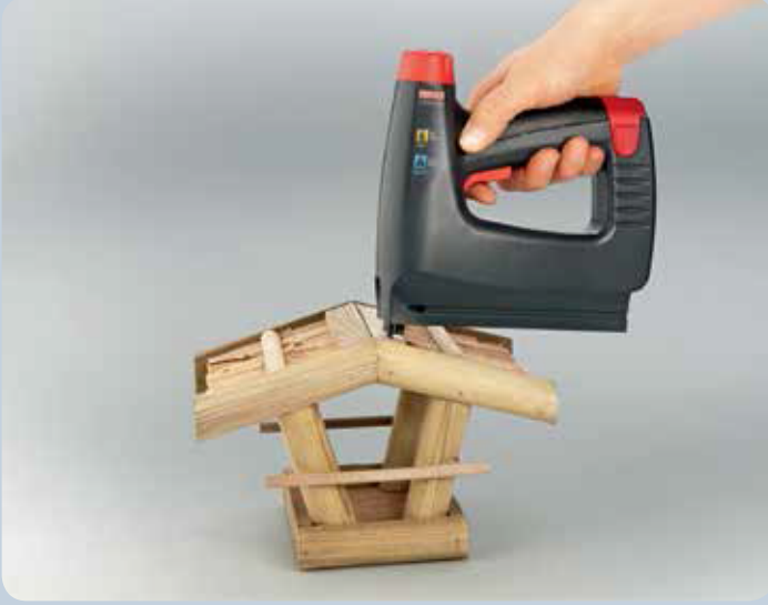
Hızlı bağlantılar için seri çivi çakma