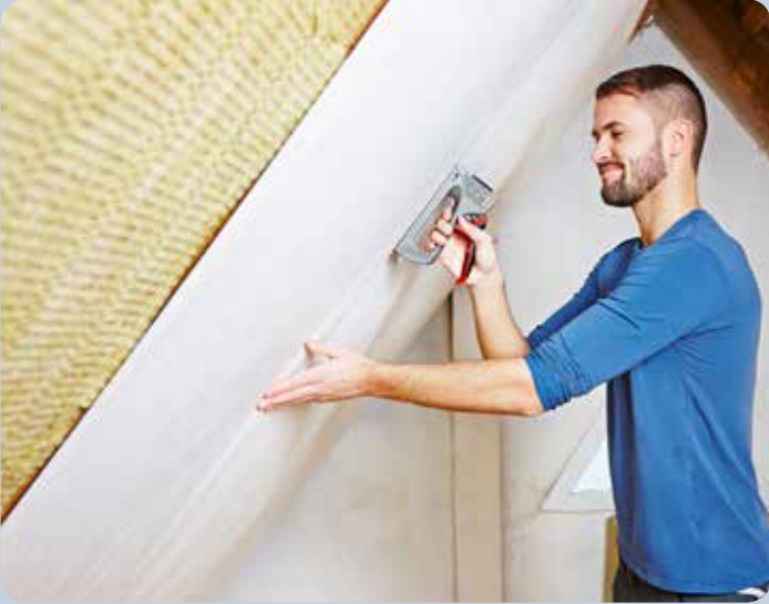
Çatı ve vb. kaplama işleri