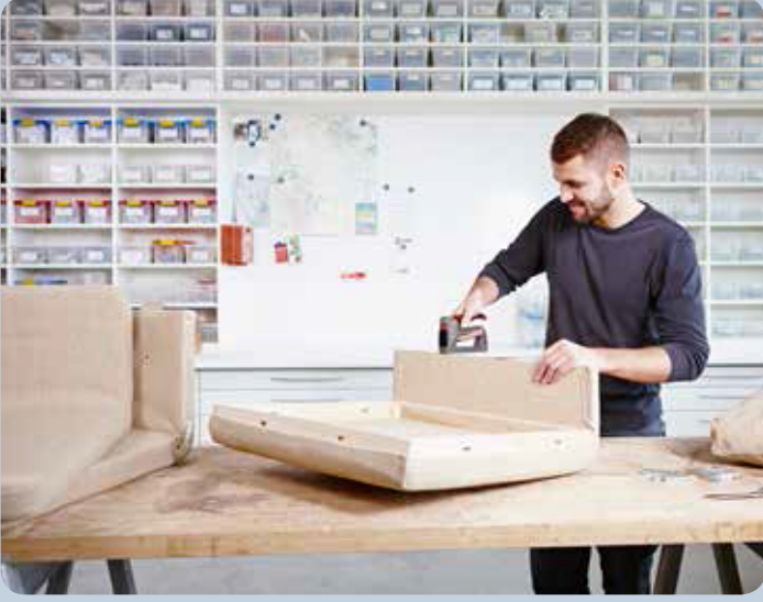
Koltuk kumaşı döşeme