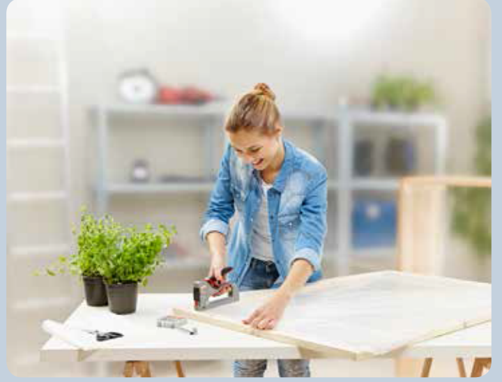
Kaplamaların kolayca takılması