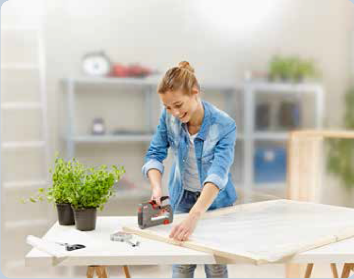
Kaplamaların kolayca takılması