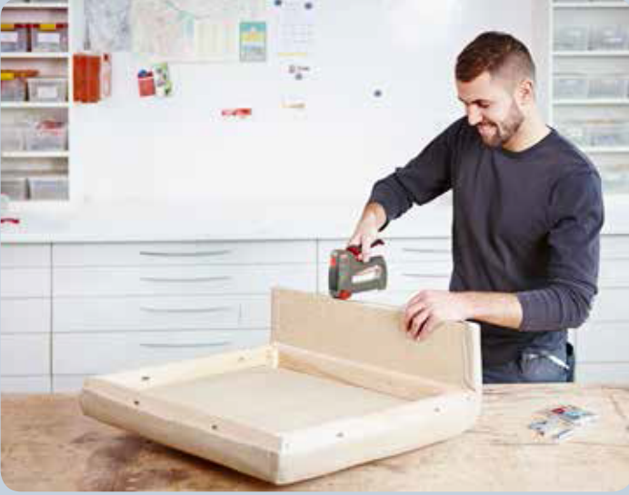
Koltuk kumaşı döşeme