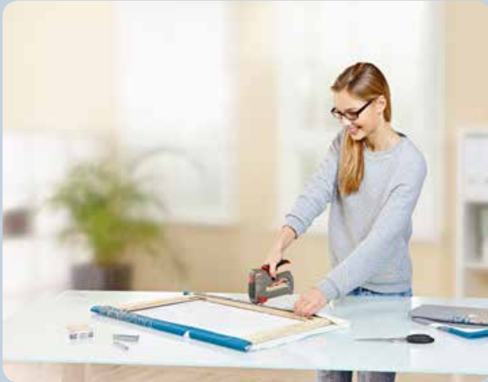
Quickly covered picture frame.