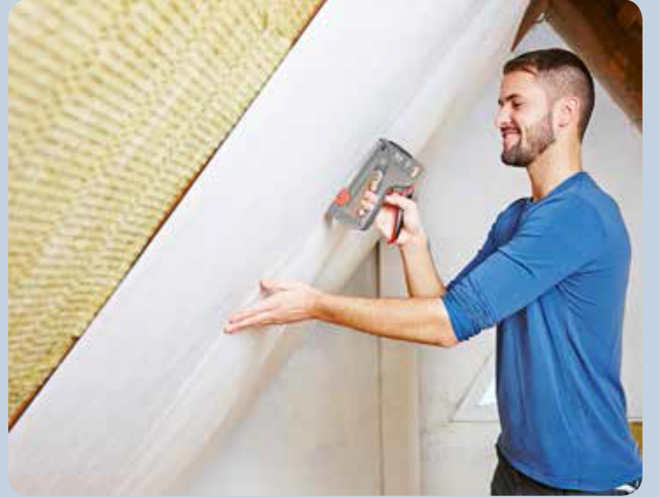
Çatı ve vb. kaplama işleri