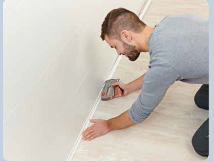
Pervaz lambri çivileme ve dekorasyon işleri