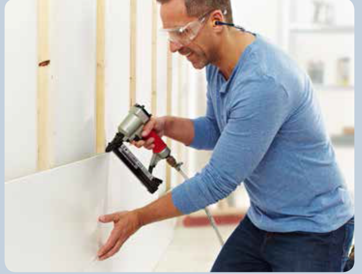
Lambriyeri klipsiz olarak zımbalamanması