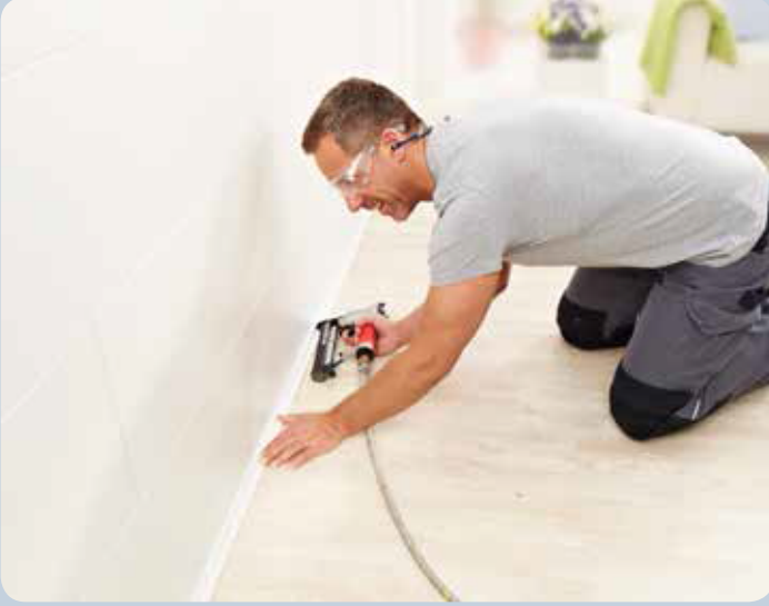
Pervaz ve köşebentlerin çakılması