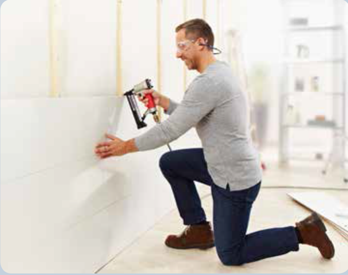
Panel klipslerinin çakılması